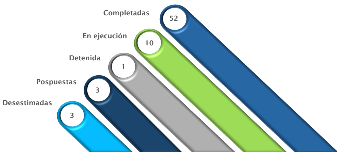
Ilustración 2 | Estatus iniciativas POA, T4-2025

En consecuencia, esto deja un total de 63 iniciativas para el cierre del POA 2025. Muchas de las iniciativas que continúan en ejecución forman parte de proyectos plurianuales o experimentan factores externos que extendieron su ciclo de desarrollo.